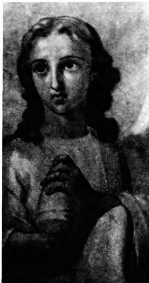
П. Т ю р и н. Архангел Рафаил. Фрагмент росписи в куполе Вознесенского собора Спасо- Суморина монастыря в г. Тотьме. 1864—1865.