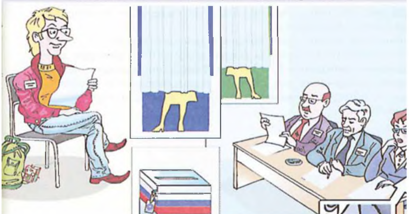
Рисунок В.В. Кремлева