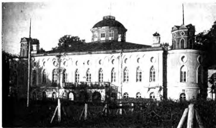
Усадебный дом Межаковых в селе Никольском. 1920-е гг.

роходе по р. Вологде, далее по р. Сухоне и, наконец, по Кубенскому озеру и по р. Ухтыге». Зимой во все концы ехали более прямым путем на санях.