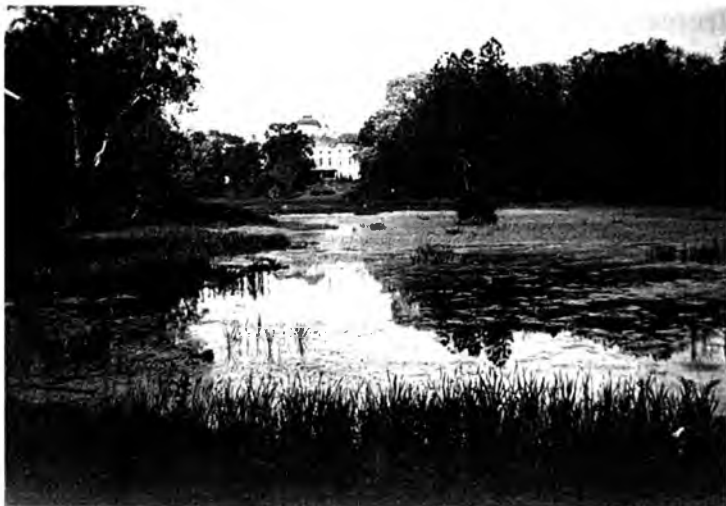
Парк в Никольском

ный дом с башнями по углам. Внутри блеск зеркал, хрусталя и паркета. За домом огромный сад в английском стиле с редкими породами деревьев, прудами, беседками, гrotтами и белыми лебедями. Перед домом центральная площадь усадьбы, мощеная морским булыжником, уложенным в крупную клетку. Слева каменный мост через речку. Вдоль речки тянутся оранжереи и теплицы, в которых выращиваются ананасы, виноград и другие экзотические растения. Против дома, по другую сторону площади, на взгорье каменная пятиглавая церковь с колокольной. За ней другая, более древняя церковь Вознесения с прекрасной шатровой колокольной. А дальше целый ряд каменных служебных строений, силосные башни, магазины и т. п. С правой стороны площади два красивых каменных флигеля, в которых находилась контора усадьбы и жил управляющий, а между ними начиналась главная ули-