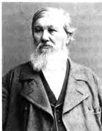
Николай Яковлевич Данилевский

зики в вологодской гимназии. Это был весьма разносторонне одаренный человек. Особенно он прославился своими арифметическими задачами, по которым учатся еще и в наши дни. Кроме того, он был известным литератором, автором романов «Сыновняя обязанность» и «Восток и Запад» и повестей, которые печатал в «Библиотеке для