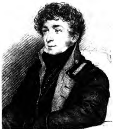
Константин Николаевич Батюшков

очевидно. Вологодское общество было связано довольно тесными родственными и дружескими узами. Дворянские съезды, дворянские выборы сближали его еще больше. И нет сомнения, что Батюшковы и Межаковы были издавна знакомы семьями. А молодые люди были один — большой поэт, а другой — поэт небольшой, но почитавший