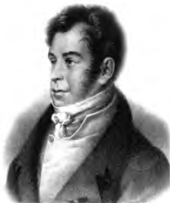
Николай Иванович Гнедич

Фамилия Брянчаниновых была самой разветвленной и многочисленной в вологодском дворянском обществе. Свое происхождение