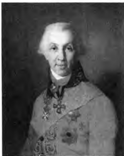
Гавриил Романович Державин

поэтов; конечно, английский — в библиотеке дома значительная часть книг была на английском языке. И что не менее важно, он прекрасно владел языком отечественным, о чем свидетельствуют его стихи и проза.