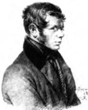
Петр Андреевич Вяземский

Москвы от неприятеля сердце у нас отлегло, и чувство уныния заменилось чувством какого-то самодовольствия и торжественности».