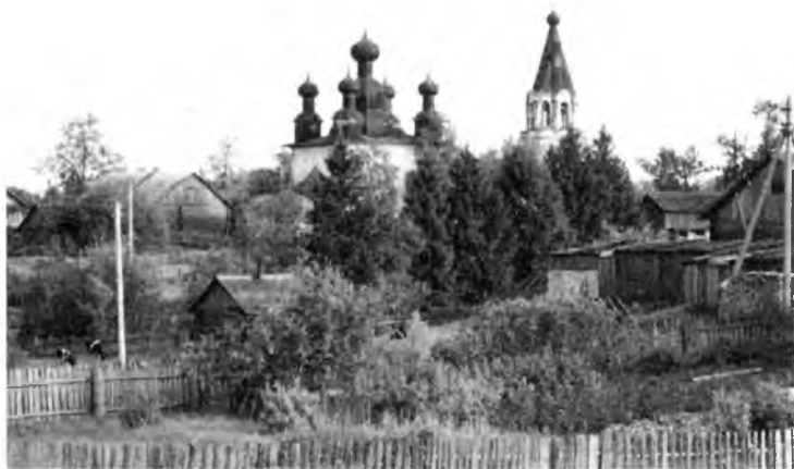
Церковь, которой больше нет. 1980-е гг.

разграблению имущества. Появлялись разные личности, вывозившие из дома мебель, картины, хрусталь, фарфор. Из картинной галереи в Вологодский музей попало только несколько семейных портретов.