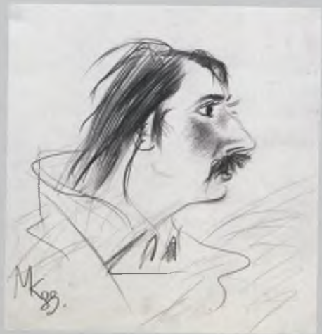
М. В. Копьев. В. В. Воропанов. Дружеский шарж. 1989. Бумага, карандаш.