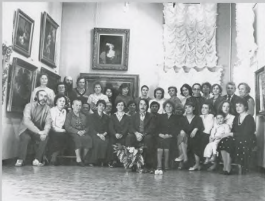
Открытие постоянной экспозиции в Шаламовском доме. 1988 г.