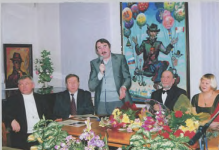
Встреча в МТЦ «Дом Корбакова». 2003.