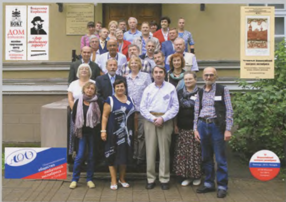
С участниками Третьего Всероссийского конгресса экслибриса у МТЦ «Дом Корбакова». 2013.