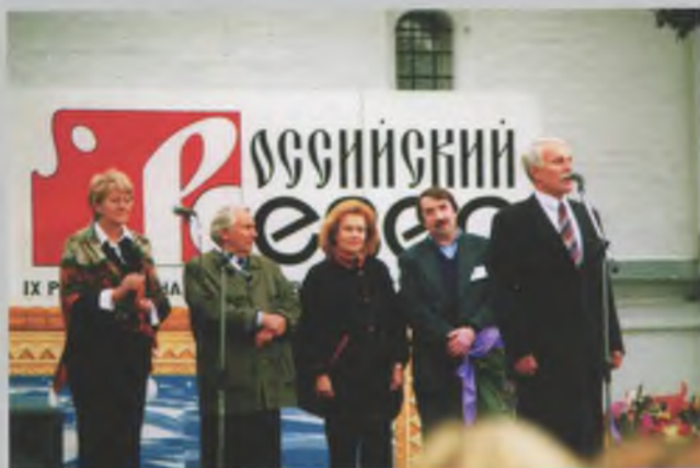
Открытие выставки «Российский Север» в Вологде. 2003.