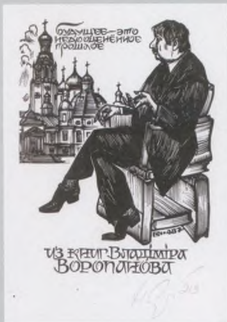
Н. А. Саутин. Экслибрис «Из книг В. В. Воропанова». 2013. Бумага, ксилография.