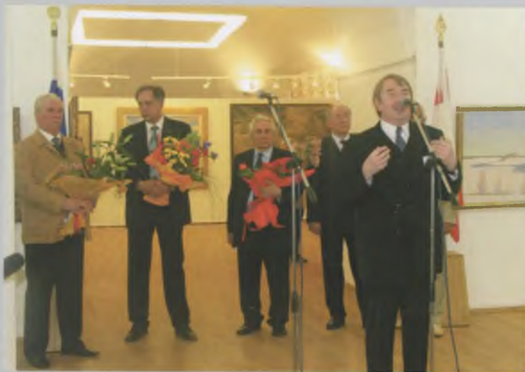
Открытие выставки «Образ Родины — 3» в Центральном выставочном зале (Воскресенский собор). 2006.