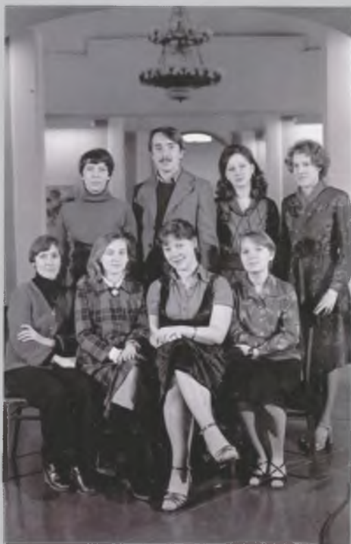
Коллектив ВОКГ в Центральном выставочном зале (Воскресенский собор). 1979.