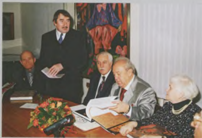
Президиум Российской Академии художеств в Вологде в МТЦ «Дом Корбакова». 2005.