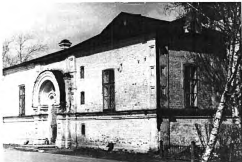
Бывшая церковь духовной семинарии — здесь располагались отделы секретных фондов, Октябрьской революции и соцстроительства ГАВО. Фото 1960—1970-х гг.

В связи с тем, что физическое состояние помещений было плачевным, часть из них оказалась не пригодной для хранения архивных источников, появлялись случаи порчи и гибели документов. В филиале госархива в Великом Устюге дела располагались в удовлетворительных хранилищах за исключением «комнаты-палатки», где находилась часть дореволюционного фонда. Как было отмечено в акте проверки за 1943 г., наличие сырости могло привести к массовому распространению плесени, в связи с чем помещение требовало систематического проветривания. Летом 1943 г. в данной комнате пострадали географические карты, которые работники архива сушили на солнышке, а затем переместили в другое место на хранение [21]. Филиал облгосархива в Череповце также столкнулся с угрозой утраты материалов. В первом квартале 1945 г. в одном из архивохранилищ была обнаружена