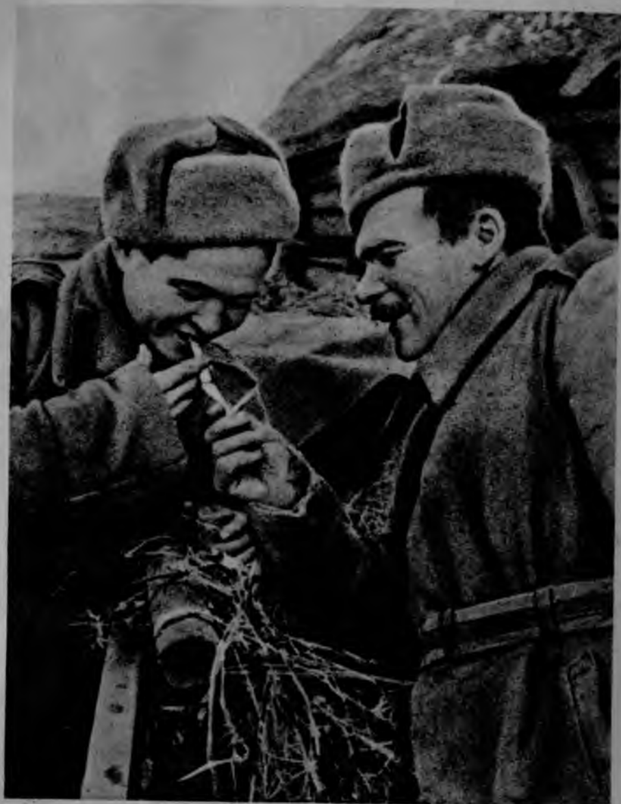
ВОЛОДИВСЬКА ЧИТАЛЬНИЦЯ Обл. Бібліотека