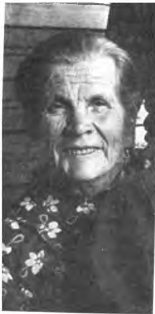
А. Д. Соколова. Фотография из личного архива Б. В. Соколова