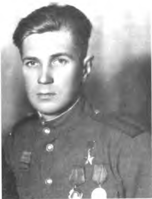
Герой Советского Союза Б. Н. Фарунцев