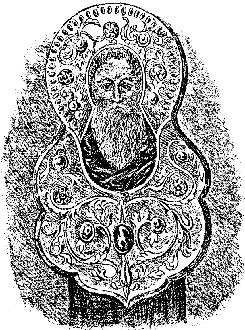
Св. преподобный Кирилль Бѣлозерскій.