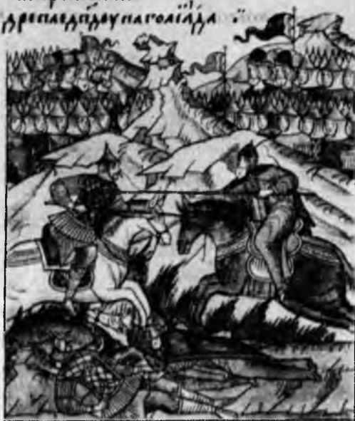
XVI. Противостояние войск Мамай и Дмитрия (вверху). Поединок Осляби и татарского богатыря (посередине) и гибель их обоих (внизу). Лицевой летописный свод

| тако поповъ кини пррпена бонгоумице ргисо дожипавелстогутекумугадо шиншра измавельстымакрпо иш кропнлещипоидеи . пррпнелюу допнагошца . таоуеуниагокнла . поупсбисви . поупсгокртианскаго поиньста . поупрпавноеговлажсн жоовилакнлазпедннн ипекнлсн пвспоннстподеуникуачеомногимн слезамнлюце . помоснемоужематпо мипрчпыапити мпои нделеты . тако дрепавддупаголда