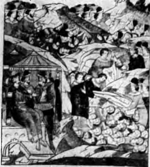
XX. Несколько моментов погребения убитых в битве на Дону. Лицевой летописный сзод

Тогда князь великий и дмитрий и шапокин исо с семь на уга галинские галимон и швы и брагта и швы. Бргодарь бргодарю патископданко подпизастель. и подо балеуешпласлужити. а мнѣ паподостю и мнѣ жалоцати. Егда мидаспогьбѣ быти масовиштинѣ на педископжонн на мовишкѣ тогда стисвию и дравота ниѣже конждо поднигнетель санкомо же пене хоронити брагтаи машу прако славоу хрпийльство и зѣенноу татарь намѣстесемь