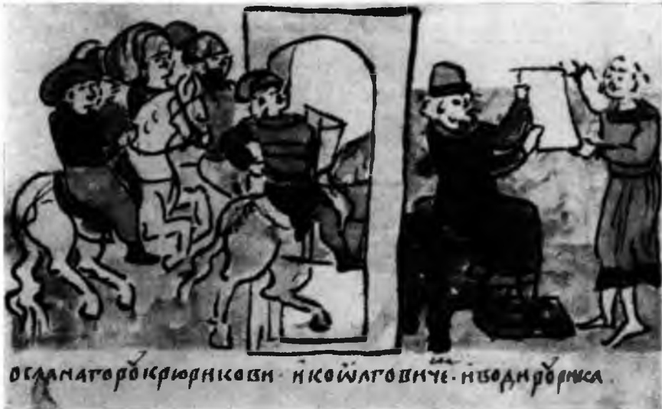
IX. Черные клубуки едут во главе с князем Романом, въезжают в Киев через Подольские ворота в Копьреве конде и приглашают Рюрика. Радзивилловская летопись