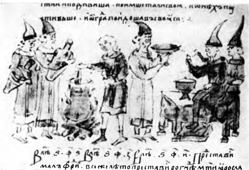
VII. Белгородцы варят сыту; справа печенежские послы едят сыту. Радзивилловская летопись