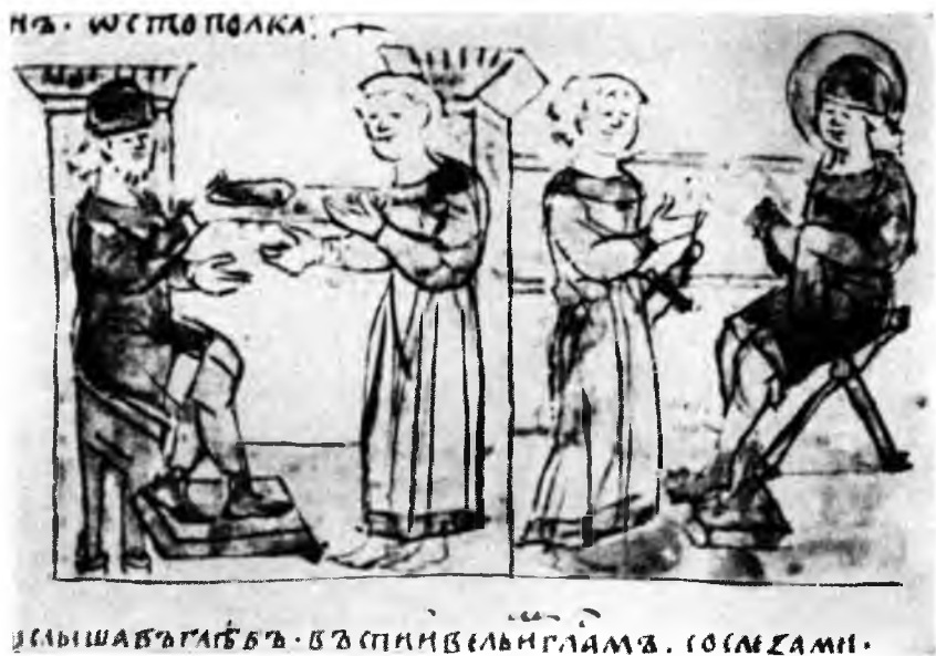
VIII. Ярослав посылает послов. Послы приходят к Глебу. Радзивилловская летопись