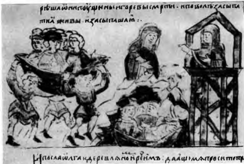
V. Мечь Ольги. Древлянских послов несут в ладье и сбрасывают в яму. Радзивилловская летопись