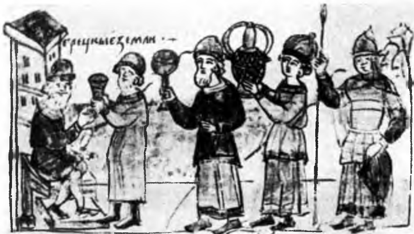
III. Олел с дружиной подступают к Царьграду. Радзивилловская летопись

Шлгъ мало ѿтвупнѣтѣра . нѣтѣмърз пѣворити со ѿ магрѣцкима . со ѿлено . нѣлѣкѣя рѣомъ . поглакми вѣ