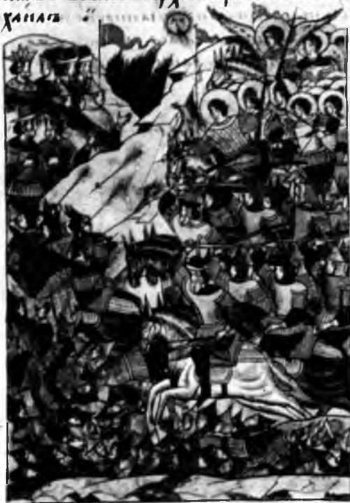
XVII. Помощь небесных сил русским войскам. Лицевой летописный свод

надъшюа въ рлннѣ колѣтн и помогающн . неспы мѣхъ гѣоки . и шѣ и плашнн кароухъ а г ш р г и . не ла пла гад мн т р и . по е л н н н х ѣ и п л з ѣ и р о у о м н х ѣ с п т ѣ г о р н ѣ и г а б ѣ и . п л н х ѣ в ѣ п о с п о д ѣ с т в р ш е п л о т о п о л ѣ п е т ѣ х ѣ о н а г ѣ . о в а н н ѣ и а р х и е п и р а п н ѣ г ѣ м н х а n a g