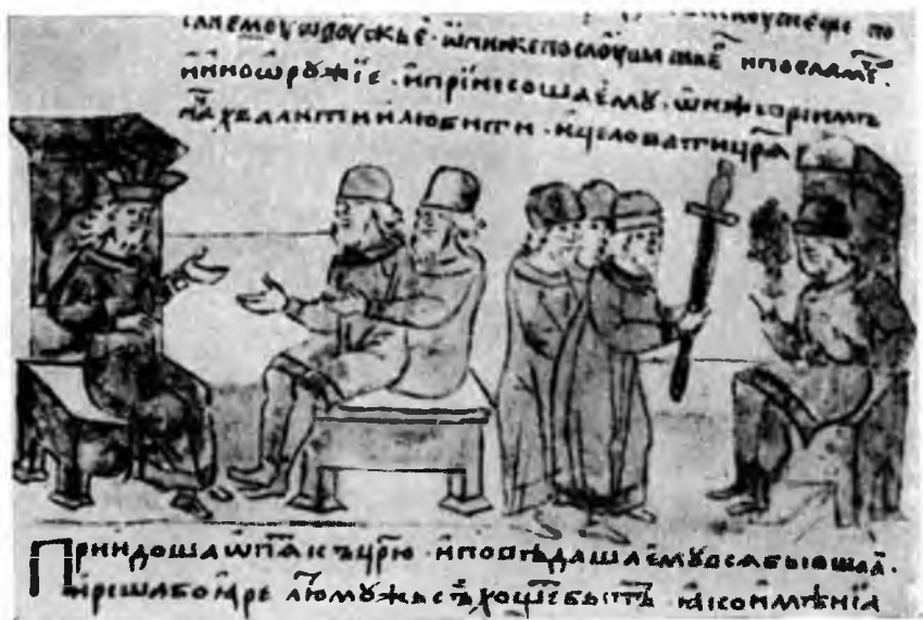
VI. Греческий царь посылает послов. Послы дарят Святославу оружие. Радзивилловская летопись