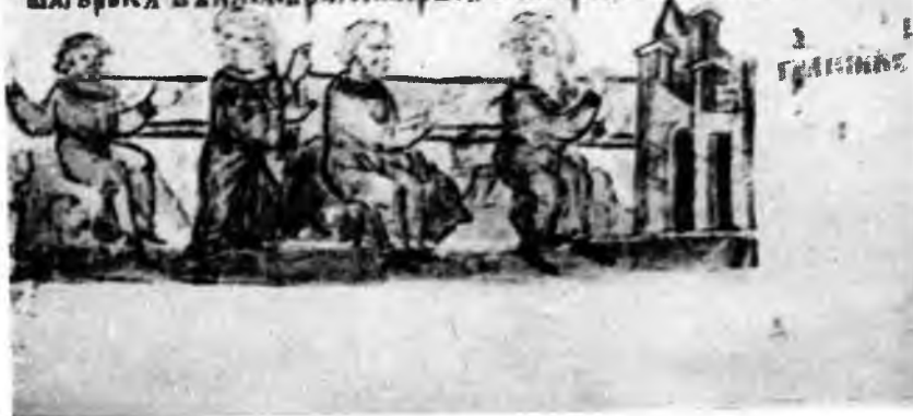
II. Кий, Щек и Хорив основывают Киев. Радзивилловская летопись

ХОРНЪ И СТРАН ЛЫБЕДЬ И СДЪЛЫ КИИ ГОРЪ ГДЪ ИИЪ ГОРНИ ВЪ АРЪ СДЪШЕ ПАГОРЪ ПДЪ ИИЪ ЦКОВИЦА А ХОРЪ ПАГЪ ГОРЪ ИИИГО ПРОЗВАША ХОРНЪ ИЦА И СЪПЪ ОРН ША ГОРОКЪ ВЪ ИИИ ПЪРА И ТАРШАГО И ПАРКОША КИСЪ.