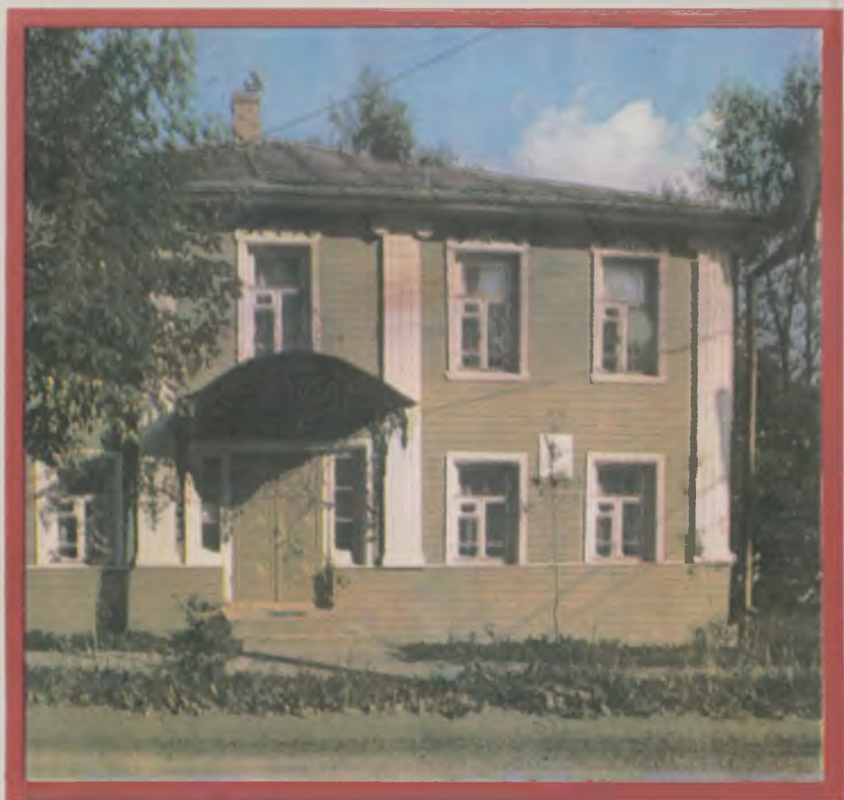
Мемориальный дом-музей Верещагиных. Общий вид