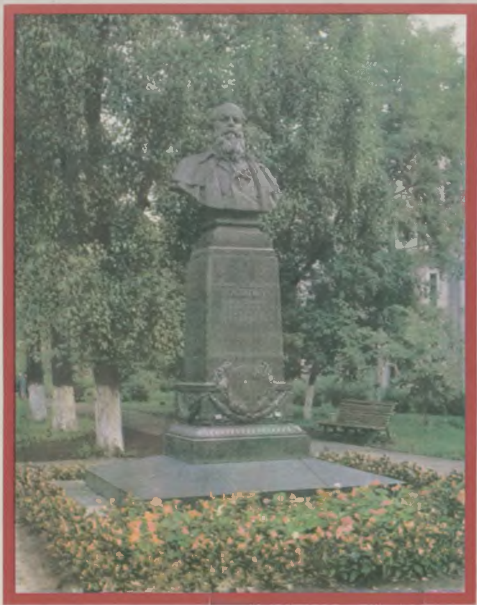
Памятник В. В. Верещагину в г. Череповце Архитектор А. В. Гуляев, скульпторы Б. М. Едунов, А. М. Портянко. 1957 г.