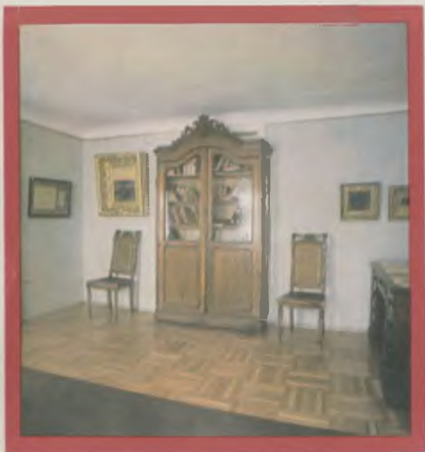
Экспозиция, посвященная путешествию В. В. Верещагина по северу России. Фрагмент