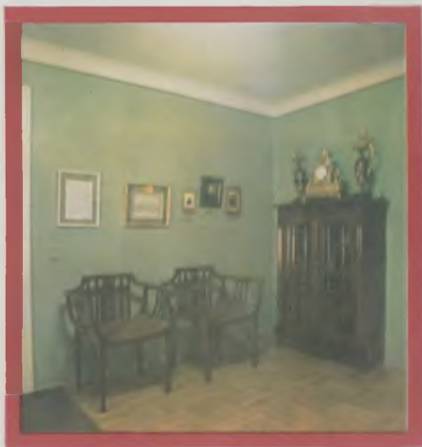
Экспозиция, рассказывающая о пребывании В. В. Верещагина в Морском корпусе. Фрагмент