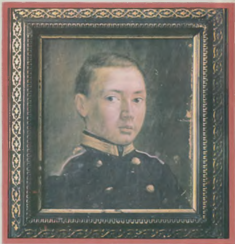
В. В. Верещагин. Портрет Сергея Васильевича Верещагина (1845—1877), выполненный художником в годы учебы в Морском корпусе. Х., м. 20×17