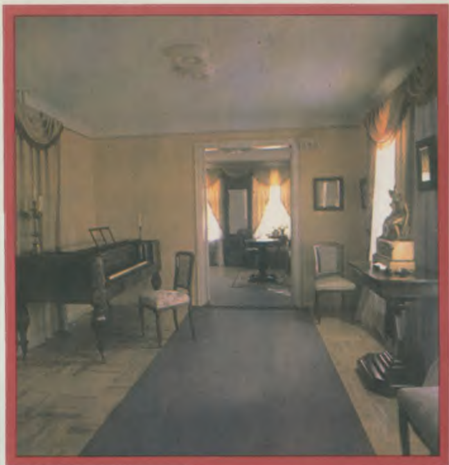
Вводная часть экспозиции музея.

«Всего нас было у отца с матерью шесть братьев и одна сестра. ...14 октября 1842 года в день папашина рождения вечером я явился на свет. Это достопамятное для меня событие случилось в городе Череповце».