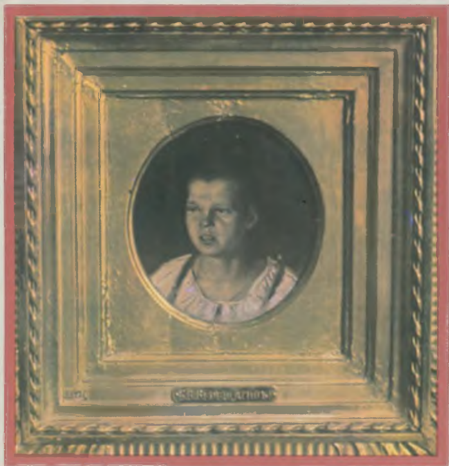
В. В. Верещагин. Эюд головы «Крестьянская девочка» Х., м. 16×16 1890-е гг.