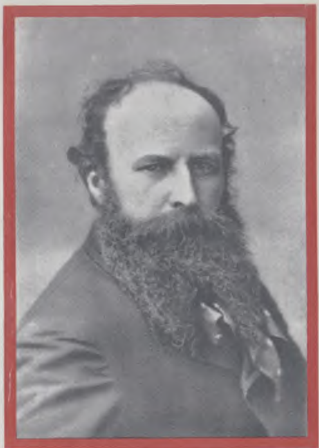
В. В. Верещагин (1842—1904). Фотография. 1880-е г.