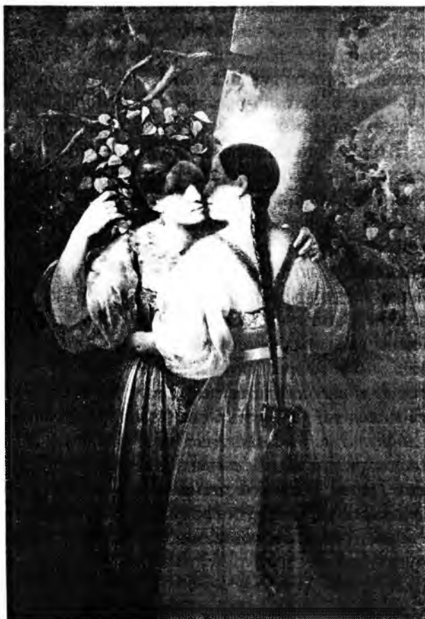
Д. О. Осипов. Две девушки в день Семика. 1860–1870-е гг. Масло

2. Балашов Д.М., Марченко Ю.И., Камыкова Н.И. Русская свадьба: Свадебный обряд на Верхней и Средней Кокшеньге и на Уфтюге (Тарногский район Вологодской области). – М., 1985.