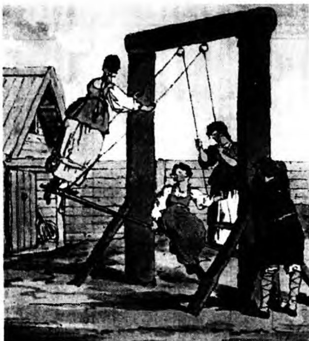
Д. А. Аткинсон. Качели. 1880-е гг. Гравюра. Фрагмент

На Николин день (6.12/19.12) наступали морозы. На Спиридона-солнцеворота (12.12/25.12) примечали: «Солнце на лето – зима на мороз». Завершался календарный цикл. Начинался новый календарный год.