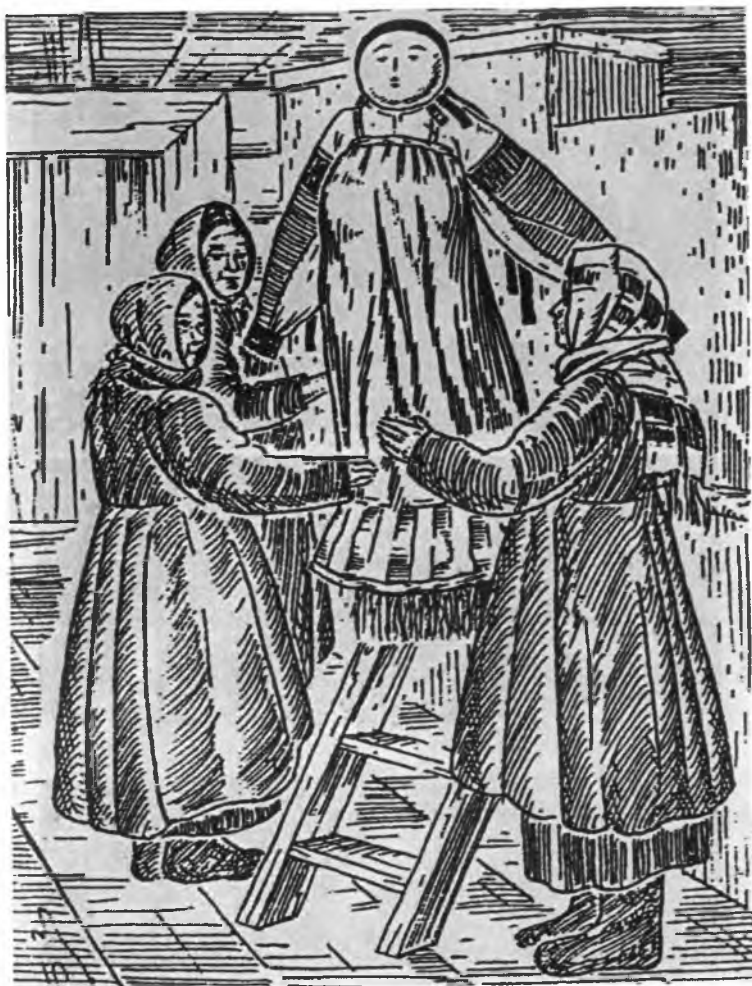
Изготовление чучела Масленицы