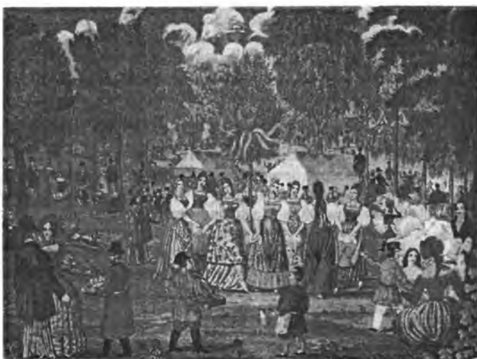
Гулянье молодежи в Семик и на Троицу