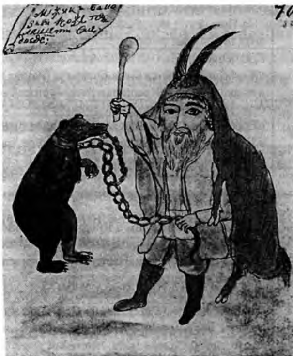
«Мужик в козьей коже пляшет с медведем». Конец XVIII в. Акварель из альбома Т. И. Енгальцева