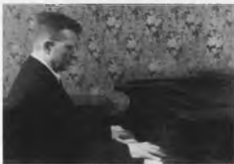
Фото Д. Д. Шостаковича с дарственной надписью

раз шел за ним следом, пять раз здоровался за руку». Вот в один из таких «разов», преодолев робость и стеснение, он и попросил у Шостаковича фотографию на память. И Дмитрий Дмитриевич сделал ему такой дорогой подарок с надписью: «Гаврилину Валерию от Дмитрия Дм. [Подпись]. 19 IX 56 г.».