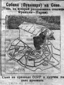
Собаян (Пунанке) на Сене. (См. в номере 1924 г. 29 марта.)

МОСКВА, 28 марта. По данным Главной физической обсерватории с середины марта в Москве ожидается резкое колебание температуры в районах между средним Днепром и средней Волгой, Окой и Донцом.