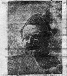
Л. Д. Троцкий