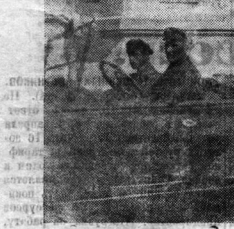
Л. Д. Троцкий