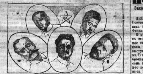
В центре: Л. Д. Троцкий; сверху: А. С. Бубнов и И. С. Уншлихт; внизу: С. С. Каменев и М. В. Фрунзе.