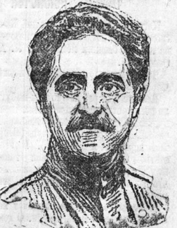
ТОВ. СЕРГО ОРДНИКИДЗЕ избран кандидатом Политбюро ЦК ВКП(б) на июльской пленуме ЦК.

ПАРИЖ, 15 августа. Металлисты Тулузы объявили забастовку, требуя повышения заработной платы.