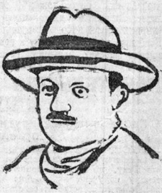
КАЙС Президент Мексик.

Начальник милиции Республики вынужден в обязанность начальникам милиции производить немедленно каждый раз расследование по всем разлетным заметкам, касающимся милиции, а в случае, явно клеветнических, прилагать виновных к судебной ответственности.