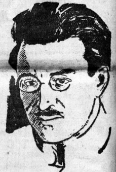
Тов. Склянский, Е. М.