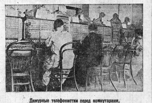
Дежурные телефонистки перед коммутаторами.

Телефонные номера на 7 станциях 639. Распределены они на 7 коммутаторов. Перед каждым коммутатором помещается так называемое многократное поле (доска, где размещены номера абонентов с гнездами для втыкания штепселя).