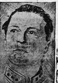
ЛЕТЧИК тов. ГРОМОВ.

В 2 час. 35 мин. дня мы летим в Париж. В 3 час. 15 мин. вечера сели на парижский аэродром Грандизоний