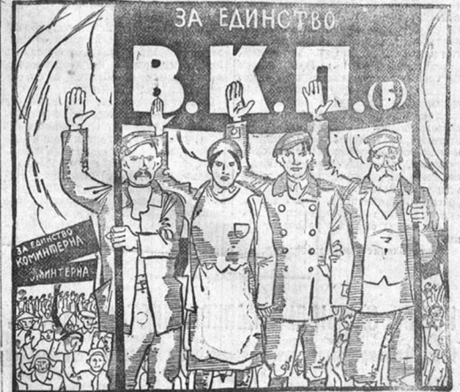
К всесоюзной партийной конференции.

Серьезные расхождения во мнениях существуют также в совете горнорабочих в Каннокчесте.