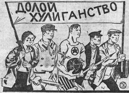
Широким фронтом на хулиганство!

трудно найти умелый подход к пропаганде за новый быт. Когда мы знаем, что в такой то месте не хватает газет, газеты не будут заказываться по заказам и подоминика. Когда мы знаем, что в такой то библиотеке не хватает книг, мы узнаем и то, какими книгами библиотеку пополнить, чтобы она активно действовала.