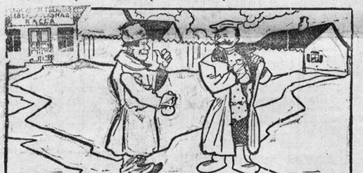
— Деньги есть! — Не сомневайся, и не ложь рубли в кубышку, постарайся в кассу вложить их на книжку!

регатальная касса. Нынче проценты на вклады увеличены до 9 проц. по срочным вкладам и от 6 до 8 проц. по бессрочным.