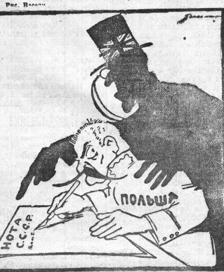
Под диктовку великого спецдалькота нот...

Польское министерство иностранных дел заканчивает выработку ноты СССР в связи с заключением советско-литовского договора.