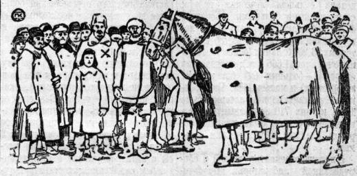
Крестьянским кооперативным обществом товариществам принадлежит до 70.000 племенных производителей: средн. племенного молодняка, 5 принадлежит кооп. товариществам и три отдельных хозяйства.