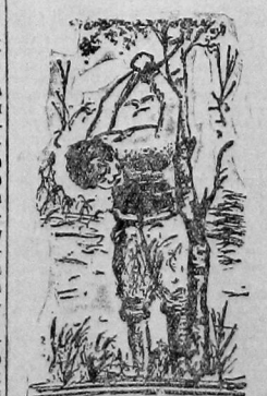
Рабочий, заподозренный в сочувствии коммунизму, признан в лучшем случае положеним к дереву.