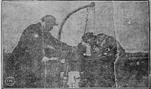
Чистка причальных и якорных цепей в Ленинградском порту.