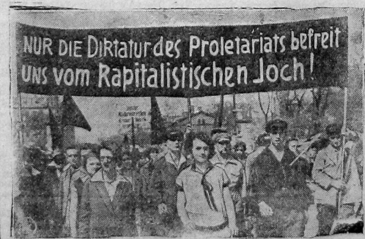
На плакате надпись: Только диктатура пролетариата освободит нас от капиталистического ига.