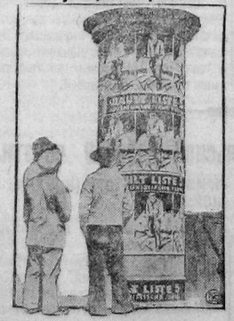
На снимке: Работе у предвыборных плакатов германской коммунистической партии. (Выборы в Германский рейхстаг (парламент) будут проходить 20 мая.