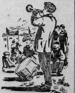
Горнист играет наступление.

Горнист играет наступление. Рупор с трубуны отдает последние жуткие распоряжения в разные кон-