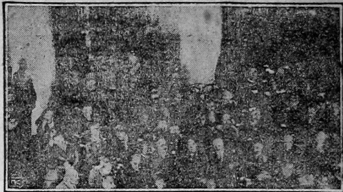
Подсудимые—«герои» шахтинского дела. (В первом ряду сидят защитники подсудимых).

говорит он,—во всем, кроме вредительства. Вредительством я не занимался.