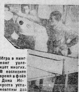
Игра в пинг-понг увлекает многих. В последнее время в фойе Дома Искусств установлены два стола для этой игры. Желающих сыграть в пинг-понг находится много.

Советская площадка с нынешнего лета предназначена для работы кружков физкультуры и для проведения соревнований. В ближайшее время, под руководством губсовета ФЭК, на