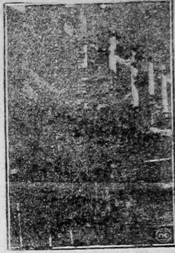
На снимке — первый советский конструктивно-автоматизированный и изготовленный в СССР аппарат для крашения текстиля.

углам (керосин и нефть в Швейцарии самым дорогим); теперь на двух крупнейших сыроваренных фабриках Австрии нагревание котлов паром при чем этот последний вырабатывается и подается электрическими турбинами. Судя по первым опытам, 1 киловатт-час будет обходиться не дороже, чем 500 гр. угля.