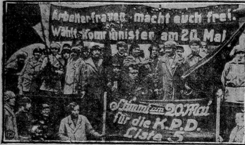
Красные фронтовички развешивают на грузовике по улицам Берлина избирательные плакаты: «Женщины-работницы сбросьте его, выберите 20-го мая коммунистов» и «Голосуйте 20-го за список № 5 ГМН».

на демонстрации коммунистов резиновыми палками и в нескольких случаях стреляла по демонстрантам холостыми патронами.