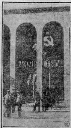
12 мая состоялось официальное открытие Кельнской выставки печати. Часть павильона, в том числе советский, будет открыты в последних числах мая. На снимке—вход в здание советского павильона.