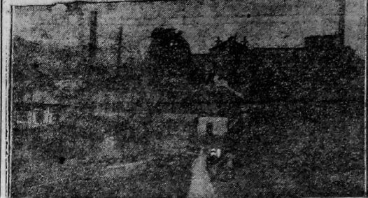
Матан - Ивановский металлургический завод. Один из самых старых заводов на Урале, основан в 1756 году. Завод входит в Южно-Уральский горнозаводский трест — первый по количеству выпускаемой продукции металла на Урале.