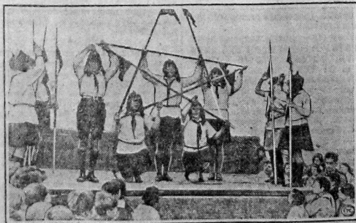
ПРАЗДНОВАНИЕ ДНЯ ДЕТЕЙ РАБОЧИХ В КЕНИГСГЕЙНЕ БЛИЗ БЕРЛИНА. На торжестве присутствовало 61-700 детей. Театральная детская группа «Красные барабанщики» инсценирует на групповке «Кавалерия Буденного».