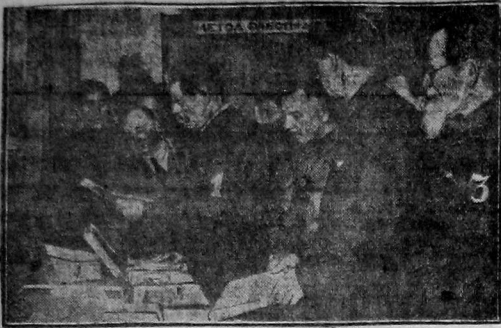
М. Горький во время его посещения Дока Красной Армии. 1) М. Горький 2) тов. Ворошилов, 3) Феликс Мон