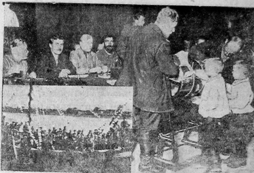
Один из моментов розыгрыша займа: На снимке влево внизу—красный баркас, переполненный крестьянами, встречает пароход

— Ура!—дружно гогосил берег. Звук марша, ответное гура широко