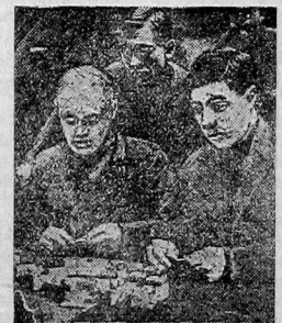
Перед началом тиража. — Проверяют билетики.

ПРОИЗВОДСТВО РАСШИРЯЕТСЯ. НОВОРОД, 16 января. Механи- ческий Боровичский завод, изгото- вляющий взлъжные машины, ране- вышедшее из-за границы, расшири- ло свое производство. Вместо 200 из- готовленных в прошлом году, в теку- щем будет изготовлено 400 машин. Завод намечено расширить и довести ежегодный выпуск до 1.000 машин.