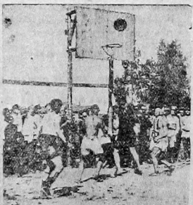
Соревнования по баскетболу на стадионе Октябрьского поселка.

1-го августа у нас же в Вологде начнется спартакиада Северного района РСФСР, после чего лучшие силы физкультурников Севера, в количестве до 135 чел. поедут в Москву на Всесоюзную спартакиаду.