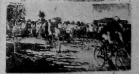
Гонки на водолоне Октябрьского поселка

Переходящий приз—знамя Губпрофсовета, взятое на зимнем губ. празднике кружком железнодорожников, будет разыграно на губспартакиаде и передано лучшему по своим спортивно-техническим достижениям на соревнованиях кружку ФК при профсовете.