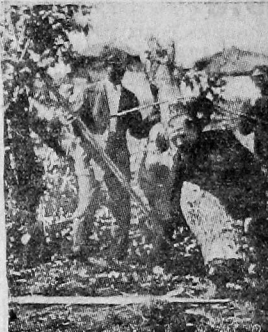
Сейчас в срочном порядке производится работы по устройству городского стадиона. На снимке: очередной субботник.

(мужск. и женск. команды); из отдела легкой атлетики для мужск. бег на 100 метр., шведская эстафета в 800, 400, 200 и 200 метров. Командный бег по силно пересеченной местности на 5 килом., пятиборье (прыжки в длину с разбега), метание копья, бег на 200 метров, метание диска и бег на 1.500 метров.