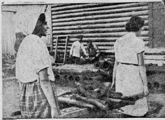
Работницы водосвета в очередь маршировали по двору...

На днях, 18 июля, на водосвете был проведен второй субботник. Работали во дворе старой городской электростанции. Два часа, 16 чел. рабочие, работницы и служащие водосвета — занимались по уборке дво-