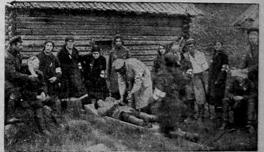
Группа санитаров и санитарок Няндомы на очередных практических занятиях

тарный и др. Оружием ячейка обеспечена в достаточном количестве. Имеется 30 шт. противогазов новейшего