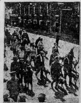
В Москве на днях прошла демонстрация военных и служебно-разъездных собак. На снимке: колонна проходит мимо Моссовета