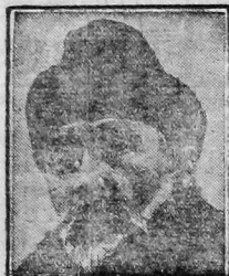
Г. В. ПЛЕХАНОВ

Надо было отстоять рабочий класс от теоретического влияния социал-реформизма. А между тем, как было