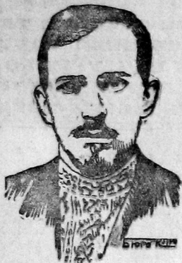
А. В. ЛУНАЧАРСКИЙ в период ссылки в Вологодской губернии 1901—1903 год

крестьян против помещиков и в то же время не прерывающую дальнейшему ходу расхождения в деревне и росту дальнейшей классовой борьбы