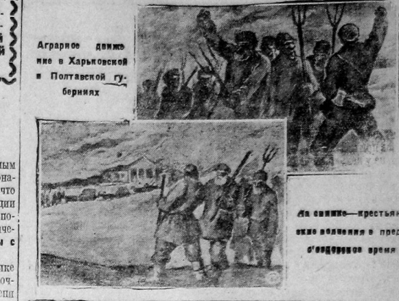
Аграрное движение в Харьковской и Полтавской губерниях

Выбрасывая его из программы социал-демократов было бы явной неслепотой. Но вместе с тем, этот демократический принцип для пролетарского революционера не мог стать неприкосновенным. И не только потому, что осуществление программы максимум предполагало диктатуру пролетариата, то есть явное отрицание всеобщего избирательного права. Но и потому, что в ходе буржуазной революции этот принцип в известных условиях мог стать предельно максимальным завершением этой революции.