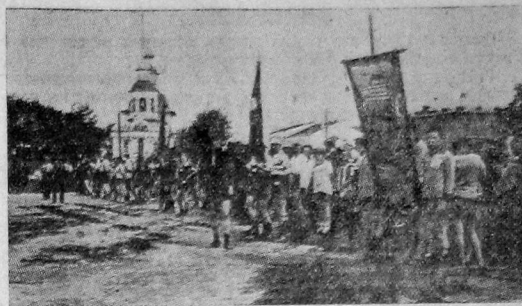
Молодежь на празднике физкультуры в Вологде

О подготовке и ходе работы каждой комсомольской ячейки должна писать в нашу газету, делиться опытом, достижениями и недостатками в этой большой и важной кампании.