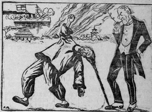
ЧЕМБЕРЛЕН: Только такая либеральная политика может обеспечить Китаю мир и благополучие...

«Английское правительство никогда не отступало от своей либеральной политики по отношению к Китаю»... (Из заявления Чемберлена в парламенте).