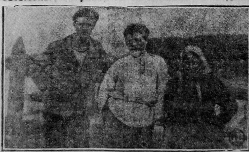
М. И. Калинин отдыхает на своей родине — в дер. Верхн. Тройца, Нижегород. уезда, Тверск. г. На снимке тов. Калинин с матерью и сыном.