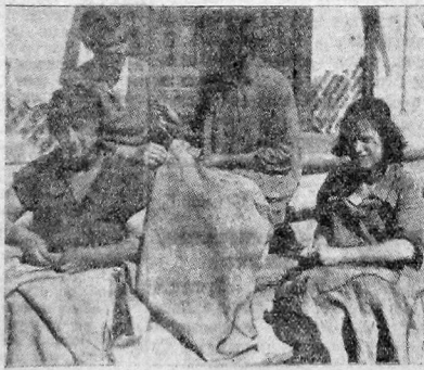
Каждая женщине, находящейся в профиланктории, не только оказывается материальная помощь, но и прививаются коллективные трудовые навыки. На снимке группа женщин трудпрофиланктория за работой

В настоящее время, по словам зав. губкомздравотделом тов. Ниникин к делу борьбы с проституцией, с безработицей среди женщин мы должны призывать все общественные организации. Как можно шире должна быть развита среди женщин помощь, не только оказывается материальная помощь, но и прививаются коллективные трудовые навыки. На снимке группа женщин трудпрофиланктория за работой