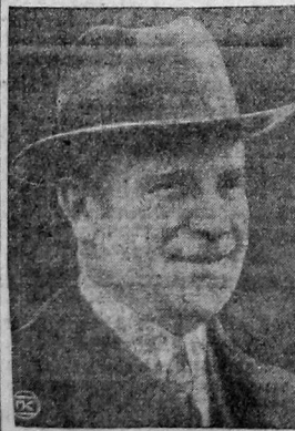
Губернатор штата Массачусетс, Фуллер, утвердивший приговор о казни Сакко и Ванцетти.

Сейчас в штате Фуллеров и Хуллидидей происходит забастовка многих тысяч заводских рабочих г. Нью-Бедфорда. Бастующие доказали свое презрение к Фуллеру, от казавшись признать его предполагаемое назначение в арбитражную комиссию для переговоров с ними. В день годовщины убийства Сакко и Ванцетти международная рабочая защита и американская рабочая партия устраивают сотни митингов в память погибших борцов. На этих митингах будут участвовать сотни тысяч пролетариев, которые, уча уроки чудовищного преступления, еще больше сплотятся для борьбы против своего классового врага.