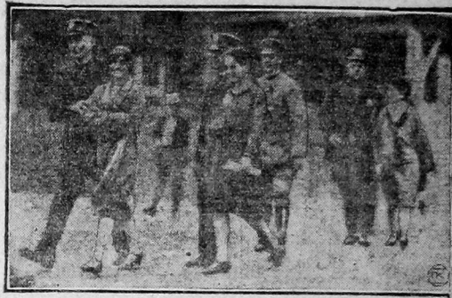
В Нью-Бедфорде (САСШ) уже несколько месяцев продолжается забастовка текстильщиков, против которых ополчились единым фронтом желтые вожди Федерации труда промышленности и полиции. На снимке: полицейские ведут арестованных пикетчиц.