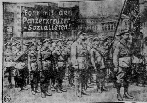
В Лейпциге состоялся средне-германский сбор красных фронтовиков и громадная демонстрация трудящихся прошедшая, под лозунгами компартии: «На защиту СССР». Вступайте в компартию», «Долой империализм и их лодунышко» и т. д. На снимке: Отряд красных фронтовиков в шлеме: «Долой броненосных социалистов».

отсталости страны, патрией правдолюбив пролетариату внутренних классовых сил и из контрреволюционной враждебной СССР политике всех империалистических государств. К этим затруднениям относятся: запросы ввоза и вывоза, основного капитала, снижения себестоимости производства и промышленных цен, безработица, товарного голода в деревнях, с одной стороны, и хлебозаготовок для городов — с другой.