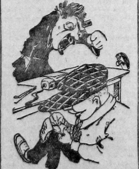
Погодите, опешил директор, вы кто такой, как ваша фамилия?

— Вот и я об этом, — обрадовался директор: — самонриятна ценная вещь. И каждый рабочий должен помогать администрации выяснять и исправлять ошибки. Конечно... Комсомолец глгнул исподлобья: — И не все правильно, только нам