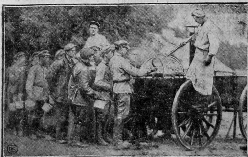
В начавшихся киевских маневрах принимает участие сводный рабочий батальон Украины. На снимке. У одной из ротных походных кухонь.