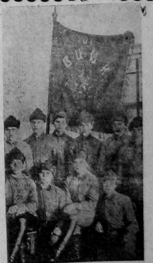
Молодые красноармейцы почетного знамени, в предшествующий ВЦИК-ю 30-му полку X дивизии