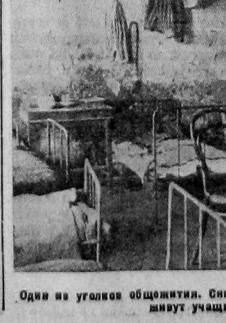
Один из уголков общежития. Снимок явно показывает в какой обстановке живут учащиеся педтехникума

В этой заметке указывалось, что обитатели общежития сорвали родительское собрание, происшедшее за перегородкой в помещении детского сада. Участники собрания рассказывали, что учащиеся педтехникума подпали в своем общежитии слова и шум, которые заглушали слова докладчика и выступивших товарищей. Эти сообщения о неурядицах в общежитии техникума, как кажется, должны были ЗАИНТЕРЕСОВАТЬ не только губоно, губпрофсовет и бюро пролетстуды, но и истрвовать всю общественность города. — В ОБЩЕЖИТИИ ПОПРЕЖНУМУ ПРОЦВЕТАЕТ ХУЛИГАНСТВО, ТВОРЯТСЯ БЕЗОБРАЗИЯ, НОТОВАРЯЕТСЯ К ЛИЦУ ЛИШЬ САМОМУ ЗАХУДАЛОМУ ПОСТОЯЛОМУ ДВОРУ.