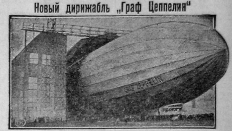
Новый дирижабль „Граф Цеппелин“