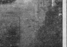
Вихри и ураганы.

Работают и множества ученых закономерности явлений в природе