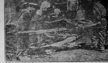
Пожар в мадридском театре 23 сентября в Мадриде (Испания) сгорел до дна крупнейший в городе театр. Пожар начался в момент последнего антракта...