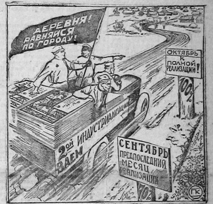
Учитель, агроном, комсомолец, сельсоветчик, от вашей активности зависит 100% реализации займа индустриализации в деревне

ПЕРМЬ, 2 октября. В текущем году велась беспрецедентная водозащитная работа по поднятию со дна реки одного из затопленных колчащавых пароходов «Марьяна». Пароход уже поднят. В порту его заделывается пробоина и к концу осени «Марьяна» отправит на навигационный ремонт в затоп.