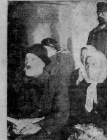
Интерес крестьян и тиражу с каждым днем повышается. Крестьяне и крестьянки — держатели займа во время работ тиражной комиссии держат в руках облигации облигаты за «чекатываемые» номера.

Работники лесной местного значения Томше-Евской вол. , за организмом совещания провозглашено коллективную подписку на заем индустриализации. Подписались 12 товарищей на 850 руб. Подписчики вызывали последовать их примеру других лесников волости.