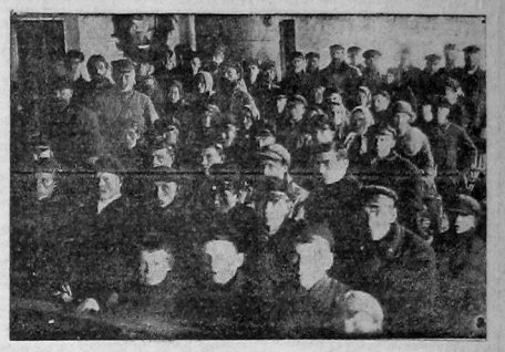
Вал народного дома не мешает всем желающим присутствовать на тираже. Помимо обычных посетителей местных крестьян тираж привлекает экскурсанты: привокитов, школьники и т. д. НА СНИМКЕ: уголок тиражного зала, на первых рядах экскурсанты — привокиты и учащиеся.

Томские члены сельхозККОВ подписались на 25 руб. займа индустриализации. Проводят подписку среди своих членов и вызывают всех остальных ККОВ волости.