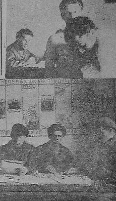
На снимке-губерский призывной пункт.