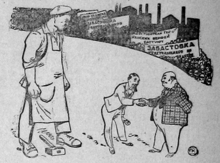
Во имя в промышленности, в классовая борьба