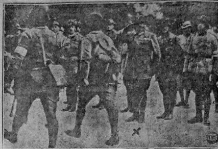
7 октября в Винер-Неиштадте (Австрия) состоялась демонстрация «Хейнера» (фабрикант) и социал-демократического штурма.