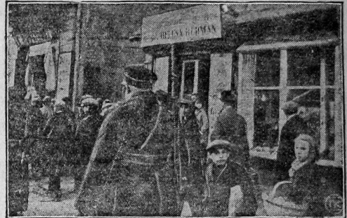
Вооруженные вивотками полицейские разгоняют скопляющихся на улице забастовщиков.