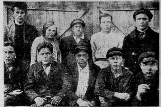
Чушавские комсомольцы — лучшие распространители займа.

денную подписку на заем. Председатели сельской комиссии содействия обращались в правление артели, чтобы оно усклило свою работу по реализации займа, но толку не добились. Среди крестьянства реализация займа может идти с успехом, особенно среди кооперированного населения.