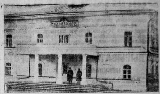
11-я железнодорожная больница в Волгоде. Великолепное оборудование на последние годы. При больнице имеется электростанция и иные устройства для стационарных больных.