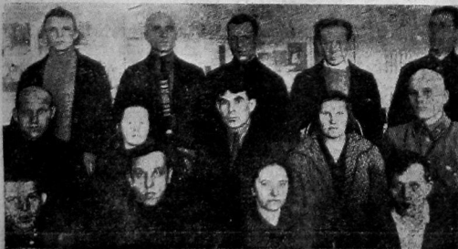
Делегаты губернской конференции от надвиновской уездной организации

В нашей губернии, где имеются колоссальные лесные массивы, вопрос лесозаготовок, лесовосстановления играет и должен играть крупнейшую роль. Но они имеют значение не только для Вологодской губернии, поскольку во внешней торговле мы даем значительное количество лесовозспорта, поскольку значение лесозаготовок имеет государственное значение. В общей площади лесов мы вырубим