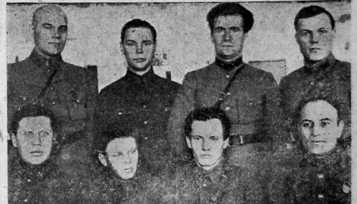
Группа делегатов на губернской конференции—военные работники

Надо отметить, что в капиталовложениях, как в местной, так и в государственной промышленности по-