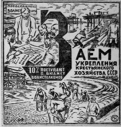
помогает благоустройству волости, так как одна десятая его поступает в распоряжение ВИН-ов.